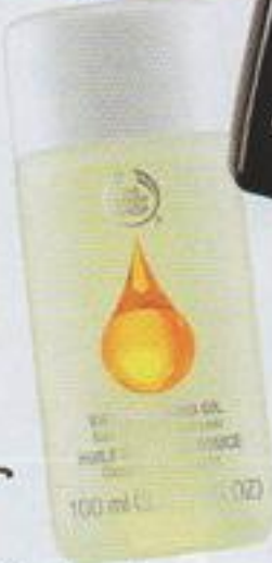
The Body Shop Sweet Almond Oil Nail Vanish Remover (390 บาท) ยาล้างเล็บสูตรอ่อนโยนปราศจากสารอะซีโตน ไม่ทำให้เล็บแห้งและเปราะง่าย