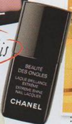
CHANEL Laque Brilliance Extreme Shine Nail Lacquer (990 บาท) สีคัสเซียนสีเข้มแวววาวและติดทนนาน ใช้ในขั้นตอนสุดท้ายหลังทาสีเล็บ เพื่อเพิ่มประกายกลอส ให้ความสดชื่นแก่เล็บ ลดการเกิดจุดสีขาว

สำหรับผู้อ่าน Lisa ที่นำหนังสือมาโชว์ ลด 20% สำหรับบริการทำเล็บทุกรายการ (หมดเขตวันที่ 31 มี.ค. 2558)