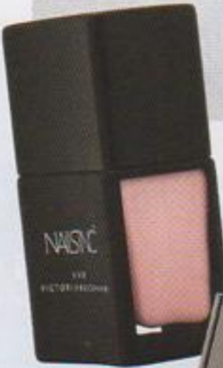
Nails Inc. by Victoria Beckham Nail Polish- Bamboo White (980 บาท) ยาทาเล็บสีขาวหม่น มีสารสกัดจากต้นไผ่และซีลีเนียม ทำให้การทาสีเป็นไปอย่างเรียบเนียน สบุดรณแบบ

ยาทาเล็บดีมีชัยไปกว่าครึ่ง ยาทาเล็บก็มีส่วนเกี่ยวข้องกับการทำลายเล็บ หากว่าใช้ยาทาเล็บที่มีราคาถูกหรือส่วนผสมไม่ดี ก็ทำลายเล็บได้ ดังนั้น ควรเลือกยาทาเล็บดีๆ หรือเลือกดูที่มีส่วนผสมไม่ทำให้เล็บเสีย อาจจะใช้ตัวเบสเคลือบก่อนทาที่ช่วยปกป้องเล็บได้นะ และอย่าลืมใช้เซรั่มบำรุงจุ่มเล็บด้วยละ เท่านั้น เล็บก็สวยใสได้ด้วยมือของคุณเอง